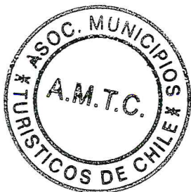
COSME MELLADO PINO ALCALDE I.MUNICIPALIDAD DE CHIMBARONGO