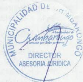
DIRECTOR ASESORIA JURIDICA